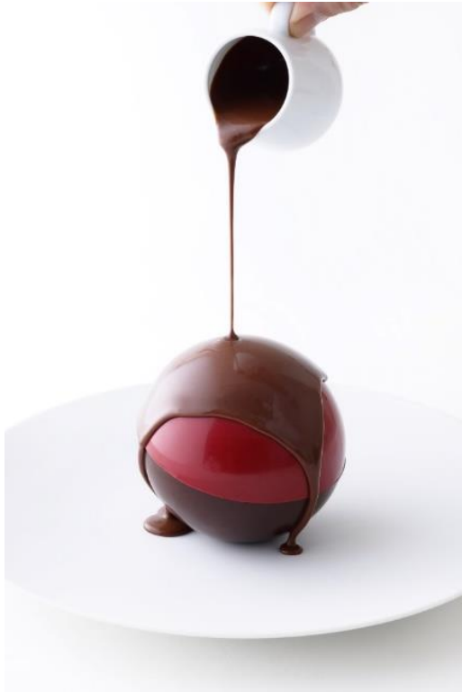
サンサシオン クロエ ガシャポン

日本旗艦店である「ピエール・エルメ・パリ 青山」の2階 SALON DE THÉ 『Heaven』が2/6(月)～2/28(火)の期間限定でガシャポンとコラボいたします。期間中、店内はガシャポン「ピエール・エルメ・パリ ミニチュアコレクション」をモチーフとした装飾にチェンジ。「ガシャポン」をイメージして作られたコラボデザート「サンサシオン クロエ ガシャポン」・「サンサシオン モガドール ガシャポン」をイートインにて楽しむことができます。上下異なる味で構成されたチョコレートカプセルに温かいチョコレートソースをかけてお召し上がりいただくデザートとなっており、何が出てくるか分からないワクワクドキドキ体験はまさにガシャポン。また、コラボデザートをご注文した方には、店内に設置しているカプセル自販機で「ピエール・エルメ・パリ ミニチュアコレクション」を1個プレゼントいたします。