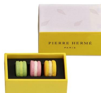
③マカロン 3 個詰合わせ