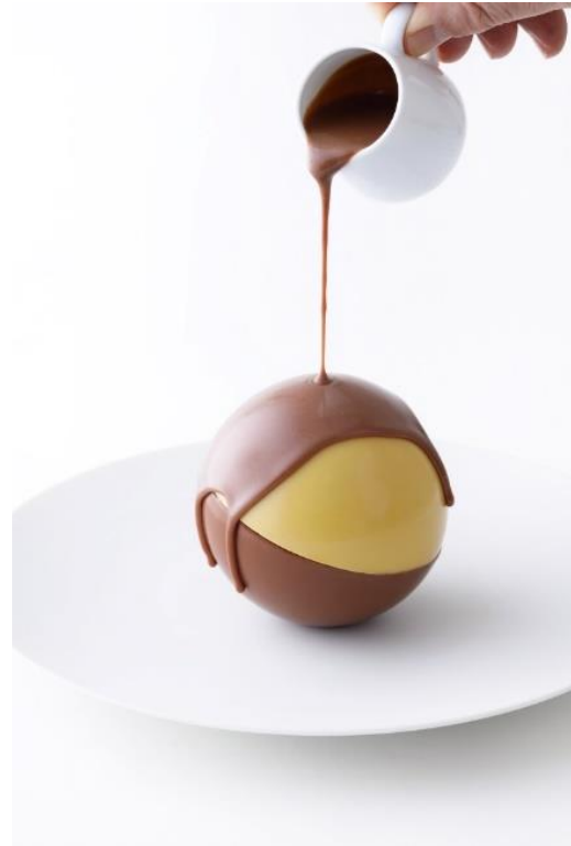
サンサシオン モガドール ガシャポン