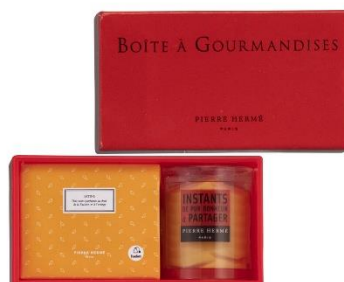
⑤サブレ&紅茶ギフト