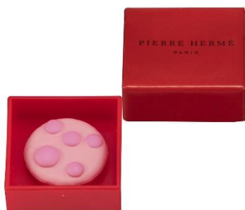
②ケーキ イスパハン