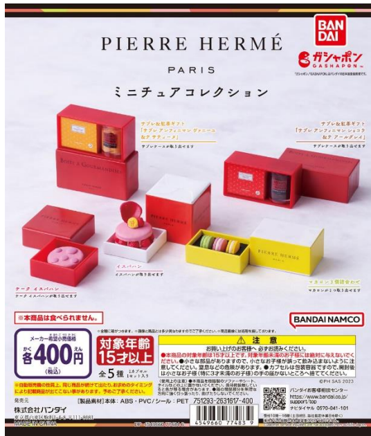
ディスプレイデザイン