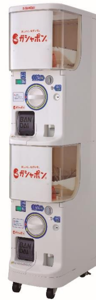
カプセル自販機(ガシャポンステーション)