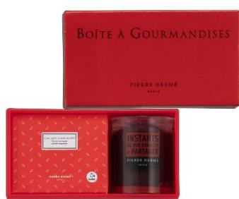
④サブレ&紅茶ギフト